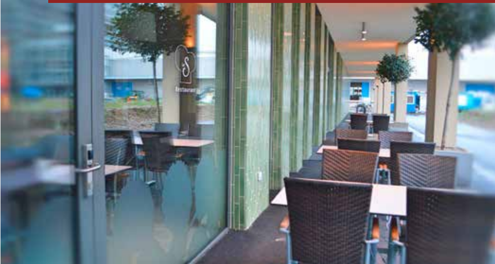
■ Baufeld C2 – Senevita Erlenmatt mit Restaurant bietet betreutes Wohnen und Pflege an.