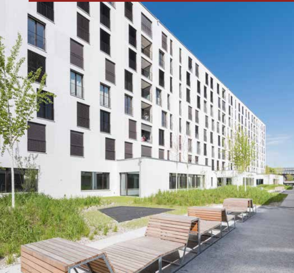
■ Baufeld G – der achtgeschossige Hochbau auf der Westseite der Parzelle beherbergt 126 Mietwohnungen unterschiedlicher Grösse.

weise mit kontrollierter Wohnungslüftung gehört auch ein gehobener Innenausbau mit Eichenparkett in allen Wohnräumen und keramischen Plattenböden in Bad und Reduit zum Standard.