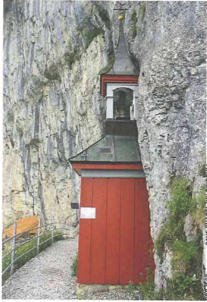
PROJECT: CAVE CHAPEL WILDKIRCHLI LOCATION: SCHWENDE (AI)