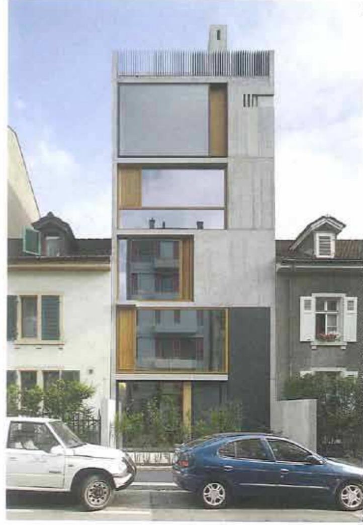
PROJECT: APARTMENT BUILDING BLASIRING ARCHITECT: BUCHNER BRÜNDLER ARCHITEKTEN LOCATION & YEAR: BASEL (BS), 2011–2012